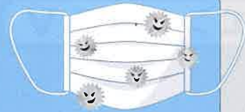
飛沫感染 ひまつかんせん