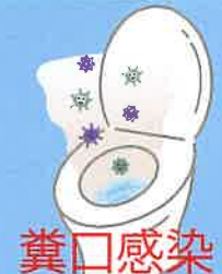
糞口感染 ふんこうかんせん